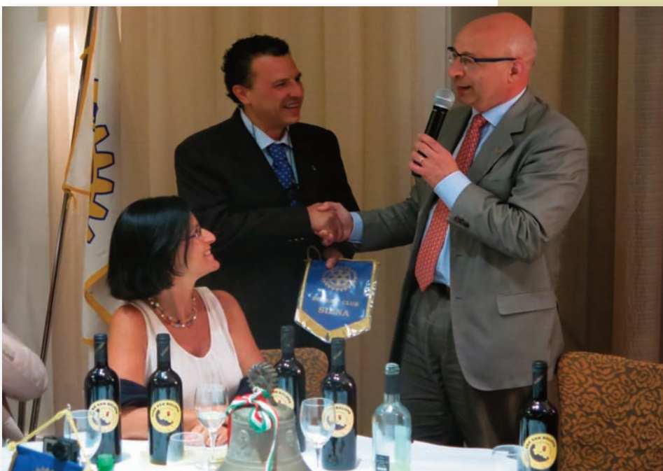
Il Presidente dona il guidoncino del Club al rappresentante della Compagnia Teatrale "Il Grappolo".

squadre investigative. Quali? Quelle composte dai partecipanti alla... cena con delitto.