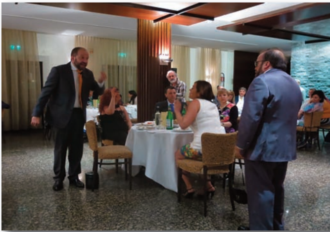
Durante la conviviale gli attori della Compagnia Teatrale "Il Grappolo" hanno recitato coinvolgendo i presenti nella storia misteriosa e delittuosa.